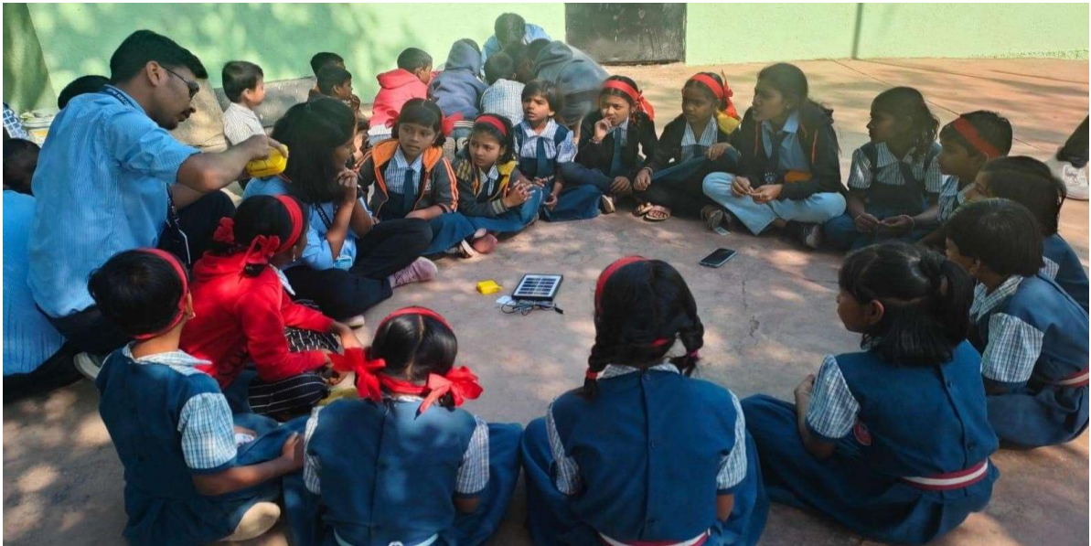
Participated in Jaldindi for River Pavana in association with Jaldindi Pratishan on 20/12/2022