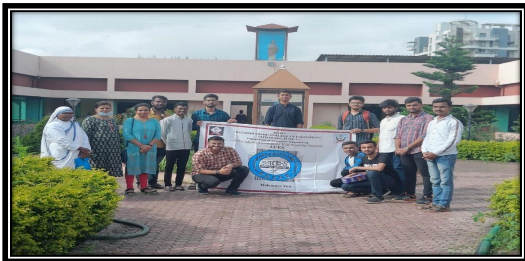
Awareness about cyber-crime, 15-08-2022